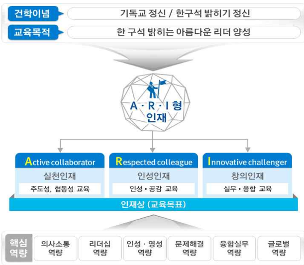
대학 건학 이념, 교육 목적 및 목표